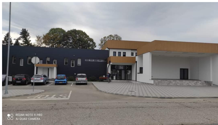
Дом културе „Србија“ – Нова Топола

Презентација игара вођена је и праћена кратким коментарима предавача тамо гдје је то било потребно. Током исте, ако су учесници имали неких недоумица или нејасноћа у демонстрацији, могли су одмах да питају и затраже додатно појашњење.